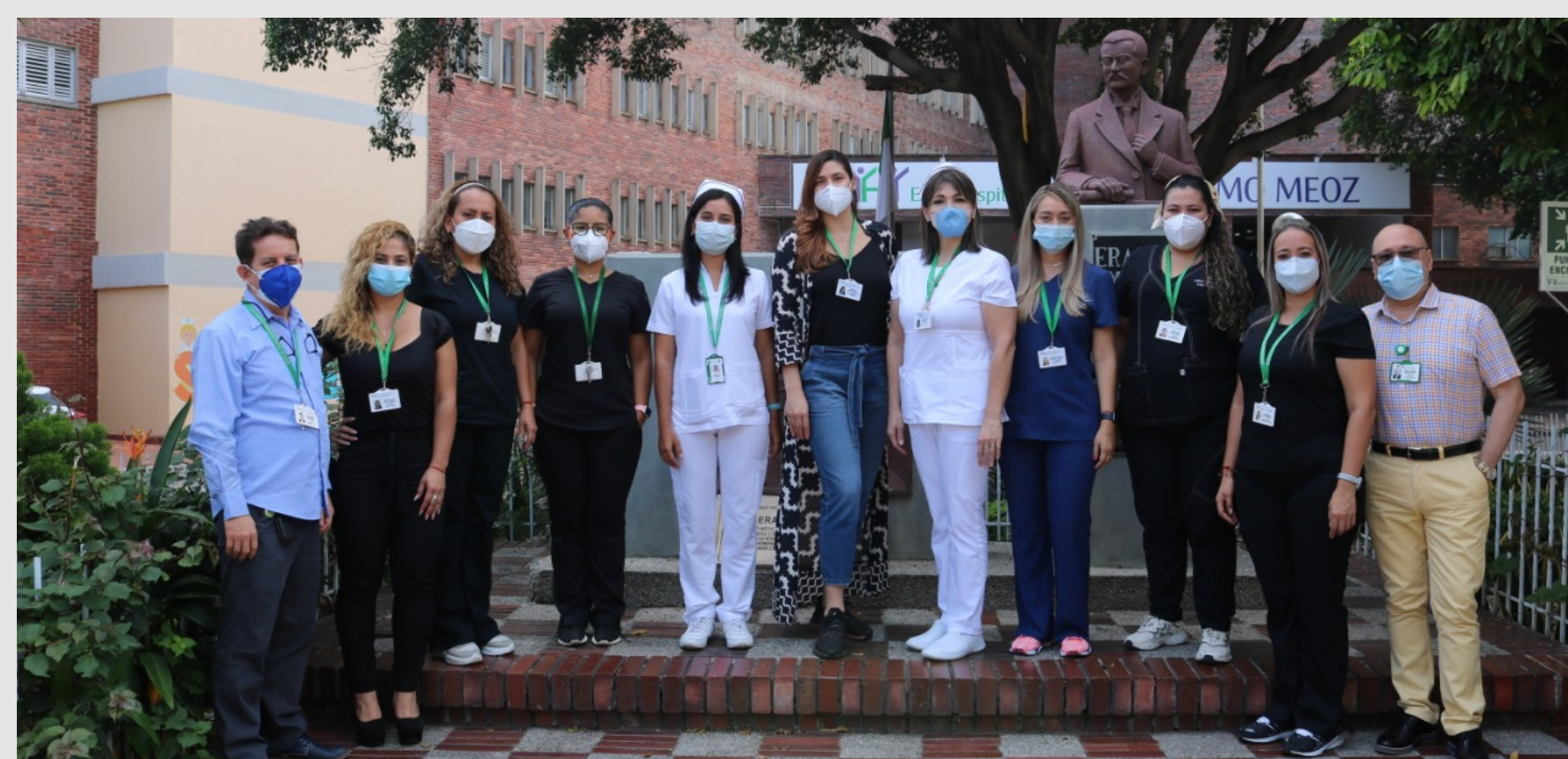
Referentes de los Ejes de Acreditación