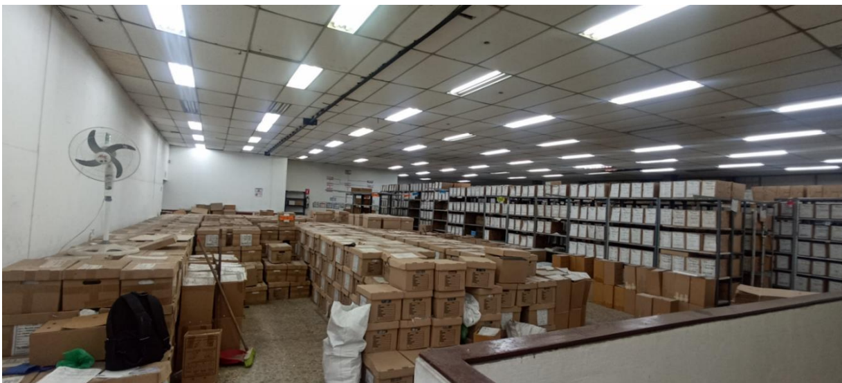
Depósito 1 de las bodegas del Terminal, donde reposan, se custodian y sirven unas 6.500 cajas #12 o X-200, unas 400 cajas #20 o X-300, y cerca de 4.800 tomos o libros empastados.

estantería usada y de diferente factura y han logrado levantar del piso buena parte de estos archivos.