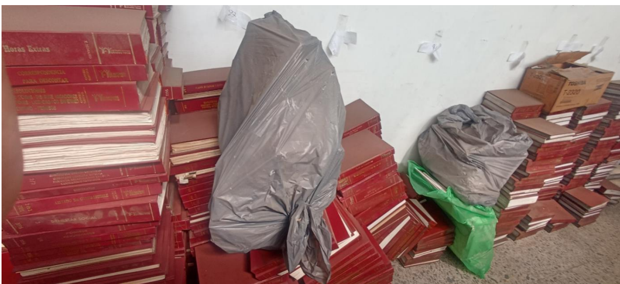
Libros de Tesorería y Financiera que durante algunos años fueron empastados. Han sido bodegados sin ningún tipo de organización ni descripción archivística. Es documentación carente de organización