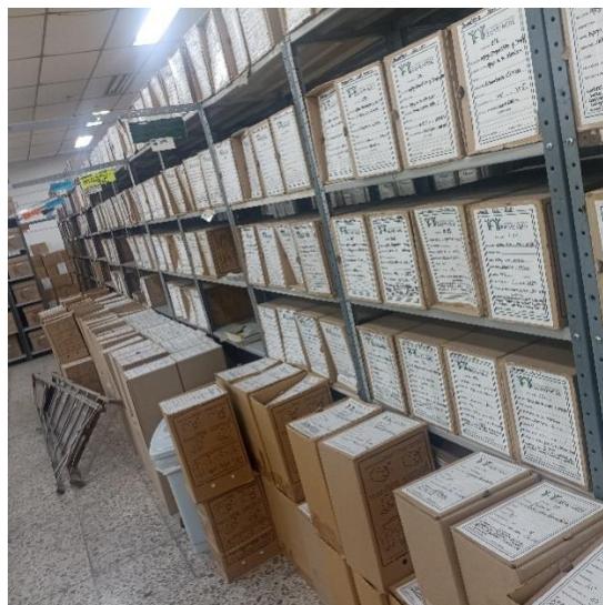
Gestión de Depósito del fondo acumulado de la ESE Hospital Universitario Erasmo Meoz. Bodega del Terminal. Estantería metálica abierta,