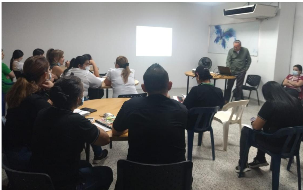
Capacitación colectiva de funcionarios en Gestión Documental a grupos de trabajo