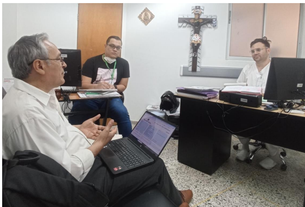
Capacitación archivística presencial individual en las oficinas productoras, tanto en conceptos como en procesos técnicos específicos de Gestión Documental.